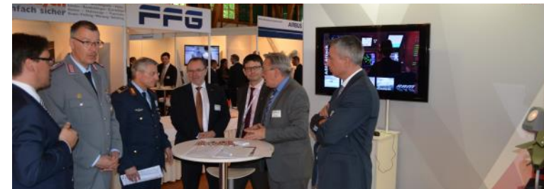
Die Veranstaltung „lebt“ seit jeher von der Ausstellung und dem hier stattfindenden schnellen Informationsaustausch, in dem es darum gehen soll, die „Policy“ und Kernkompetenzen des eigenen Unternehmens zu erläutern.