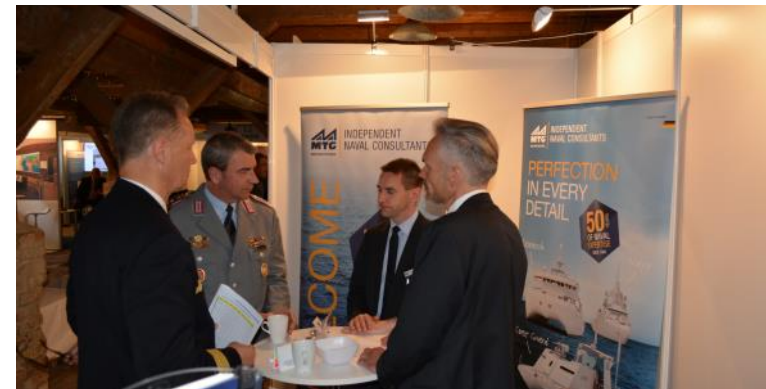
Die beliebten und erfolgreichen organisierten bilateralen Gespräche zwischen Ausstellern und Besuchern der Veranstaltung - werden auch 2018 weitergeführt.