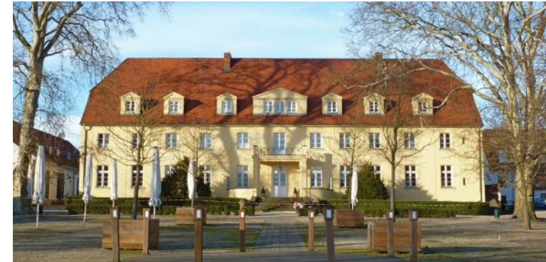
Im Jahr 2018 findet die Veranstaltung erneut an „gewohnter Stelle“ im Schloss Diedersdorf im Süden Berlins statt.

Der Teilnehmerkreis wird durch hochrangige Vertreter des BMVg ergänzt. IM DIALOG MIT MILITÄRATTACHÉS eröffnet allen Beteiligten diese Veranstaltung als neutrale Informations- und Dialogplattform zu nutzen, um eigene Kenntnisse zu vertiefen, im intensiven Gespräch zu erweitern und neue Kontakte zu gewinnen.